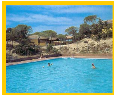
Foto della piscina