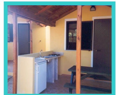
Esempio dell'angolo cottura di un villino