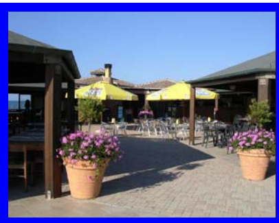
Foto del ristorante e bar sulla spiaggia