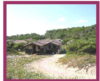
Esempio di alcuni villini